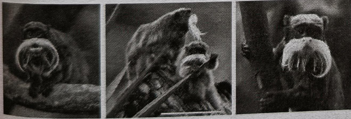
ಚಿತ್ರ ೧. ಚಕ್ರವರ್ತಿ ಟ್ಯಾಮರಿನ್ ಕೋತಿ

ನಾವೆಲ್ಲಾ ಸಾಮಾನ್ಯವಾಗಿ ಕರಿ ಮತ್ತು ಕೆಂಪು ಮುಖದ ಕೋತಿಗಳನ್ನು ನೋಡಿರುತ್ತೇವೆ. ಅವುಗಳ ಬಗ್ಗೆ ಕೇಳಿರುತ್ತೇವೆ ಮತ್ತು ಅವುಗಳಿಗೆ ಮೀಸೆಯೂ ಇರುವುದಿಲ್ಲ. ಆದರೆ ಈ ಲೇಖನದಲ್ಲಿ ಬಿಳಿ ಮೀಸೆಯ ಕೋತಿಯ ಕುರಿತು ವಿವರವಾದ ಮಾಹಿತಿ ನೀಡಲಾಗಿದೆ. ಈ ಬಿಳಿ ಮೀಸೆಯ ಕೋತಿಯ ಹೆಸರು ಚಕ್ರವರ್ತಿ ಟ್ಯಾಮರಿನ್ ಕೋತಿ (Emperor tamarins- Saguinus imperator), ಇದು ಸಣ್ಣ ಸಸ್ತನಿ ಪ್ರಾಣಿಯಾಗಿದ್ದು, ಇದು ಕೋತಿಗಳ ಗುಂಪಿಗೆ ಸೇರಿದೆ. ಪೆರು, ಬ್ರೆಜಿಲ್, ಬೊಲಿವಿಯಾ ಮತ್ತು ಅಮೆಜಾನ್ ಜಲಾನಯನ ಪ್ರದೇಶದ ನೈಋತ್ಯ ಭಾಗಗಳಲ್ಲಿ ಕಂಡುಬರುವ ಚಕ್ರವರ್ತಿ ಟ್ಯಾಮರಿನ್ ಕೋತಿಗಳಲ್ಲಿ ಎರಡು ಉಪಜಾತಿಗಳಿವೆ. ಚಕ್ರವರ್ತಿ ಟ್ಯಾಮರಿನ್ ಕೋತಿಯು, ತಗ್ಗು ಪ್ರದೇಶದ ಉಷ್ಣವಲಯದ ಮಳೆಕಾಡುಗಳಿಗೆ ಆದ್ಯತೆ ನೀಡುತ್ತದೆ, ಆದರೆ ಇದು ಕಾಲೋಚಿತವಾಗಿ ಪ್ರವಾಹಕ್ಕೆ ಒಳಗಾದ ಕಾಡುಗಳು, ಪರ್ವತ ಮಳೆಕಾಡುಗಳು ಮತ್ತು ಉಳುಮೆ ಅಡಿಗಿಂತ ಕೆಳಗಿನ ಎತ್ತರದಲ್ಲಿರುವ ನಿತ್ಯಹರಿದ್ವರ್ಣ ಕಾಡುಗಳಲ್ಲಿ ಕಂಡುಬರುತ್ತದೆ. ಜಾನುವಾರುಗಳಿಗೆ ರಸ್ತೆಗಳ ನಿರ್ಮಾಣದ ಕಾರಣದಿಂದಾಗಿ ತ್ವರಿತ ಆವಾಸಸ್ಥಾನದ ನಷ್ಟವು ಚಕ್ರವರ್ತಿ ಟ್ಯಾಮರಿನ್ ಕೋತಿಯ ಉಳಿವಿಗೆ ಪ್ರಮುಖ ಬೆದರಿಕೆಯಾಗಿದೆ. ಚಕ್ರವರ್ತಿ ಟ್ಯಾಮರಿನ್